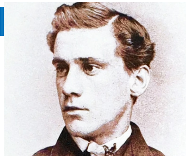
El cubano Esteban Bellán, considerado el primer pelotero latinoamericano que jugó en las ligas profesionales en Estados Unidos.

De igual modo el periódico El Artista , que se editaba en La Habana, se refirió el día 31 de diciembre de 1874 al juego efectuado en el Palmar de Junco. La nota firmada por Enrique Fon-