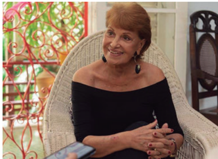
La actriz Mirta Ibarra, Premio Nacional de Cine 2025, participará en la Jornada contra la Homofobia en Villa Clara.