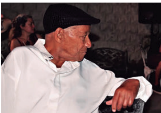
Por Francisnet Díaz Rondón

Un documental sobre la vida y obra del reconocido músico saxofonista ranchuelero