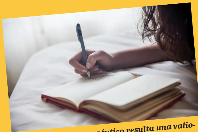
El journaling terapéutico resulta una valiosa herramienta de autocuidado.