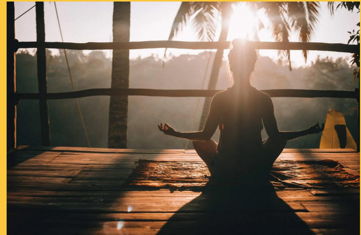
El yoga, la meditación y el ejercicio físico ayudan a mantener en óptimo estado la salud física y mental.

guiada, existen plataformas que ofrecen herramientas para ayudar a los jóvenes a reducir el estrés y encontrar momentos de calma en su día a día», añade.