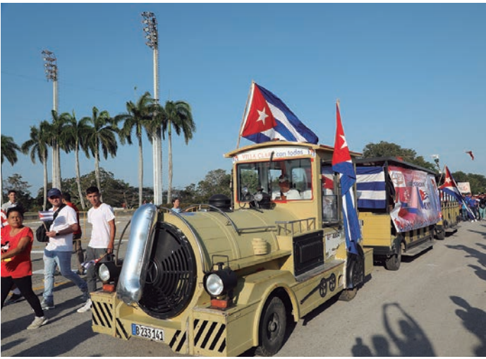
El trencito de la Empresa Provincial de Transporte irrumpió en la Avenida de los Desfiles con el gremio, que en tiempos de limitaciones con el combustible aplica alternativas para paliar las afectaciones del transporte público.