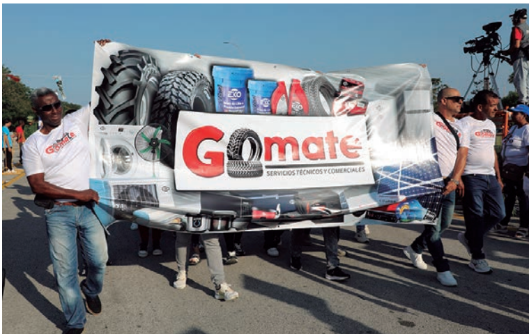
El proyecto de desarrollo local Gomate con impacto comunitario, asistió al desfile obrero, de conjunto con otras formas de gestión no estatal que también aportan a la economía local.

Por Idalia Vázquez Zerquera