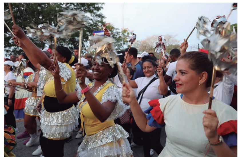
Con una contagiosa conga de entusiasmo y colorido del sector de la Cultura, cerró la marcha obrera que demostró que el pueblo no se arrodilla, dispuesto a defender la patria con las ideas bien en alto.